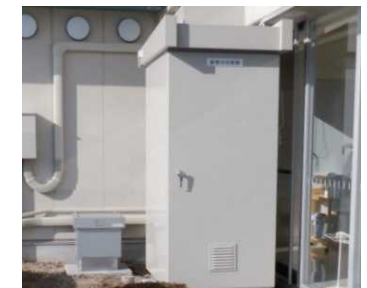
蓄電池 (駅東地域交流センター)