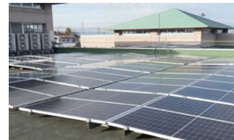
太陽光発電 (健康福祉センター-さるびあ館)